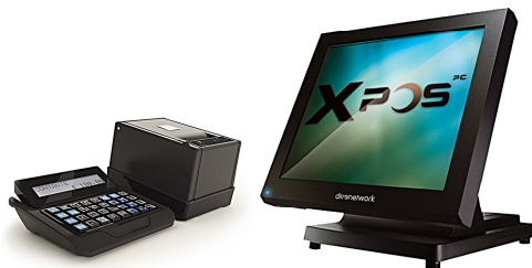
Configurazione con stampante ECR e tastiera K32