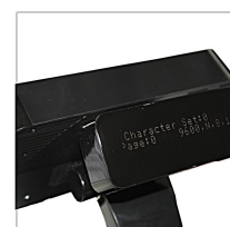
Display Integrato VFD 2x20