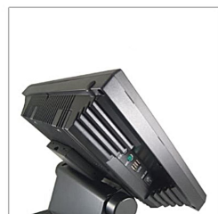
Ampia connettività per tutte le periferiche