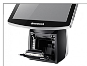
Stampante Termica 3" di cortesia, inclusa nella base