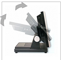
Massima orientabilità del monitor