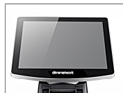
Monitor Touch Screen

Le caratteristiche tecniche sono suscettibili di modifica senza preavviso