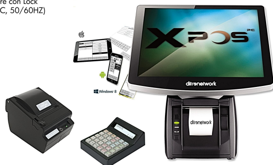
Configurazione con stampante ECR e tastiera K30

Le caratteristiche tecniche sono suscettibili di modifica senza preavviso