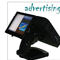
Versione doppio monitor orientabile con massima visibilità