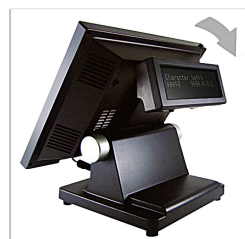
Display cliente VFD integrato 2x20