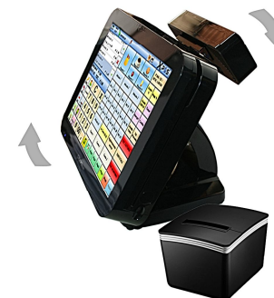
Massima orientabilità del monitor Configurazione con stampante Posprinter