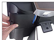
Sostituzione semplificata HDD