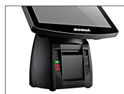
Base in alluminio pressofuso e led luminosi