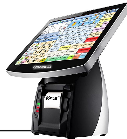
POS 10 KP

Per chi necessita di una soluzione All In One completa anche di stampante, il POS 10 KP è equipaggiato con una stampante termica per ricevute e comande ad alta velocità (250 mm/sec), inglobata nella robusta base di alluminio pressofuso: questo consente di contenere gli spazi ed avere il massimo della funzionalità in una soluzione completa.