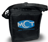
Borsa da trasporto, versione ambulante