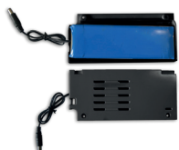
Kit Batteria, versione ambulante

Design compatto, due display a cristalli liquidi retroilluminati e tastiera meccanica a basso profilo rendono K-Bill un Registratore di Cassa semplice e funzionale, il giusto aiuto per ogni attività, ora in versione RT